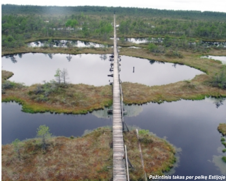
Pažintinis takas per pelkę Estijoje