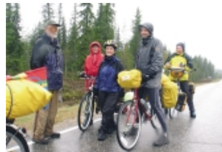
Suomijoje dviratininkus skalbė nuolatinis lietus

Estai gerokai pralenkė suomius. „Eurovelo“ dviračių trasų ir įvairių žemėlapių jie turi išleidę jau keleri metai. Žemėlapiai labai gerai parengti, pažymėtos ne tik trasos, bet ir lankytinos vietos. Jų galima įsigyti Estijoje